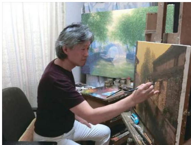
アトリエで制作中の作家