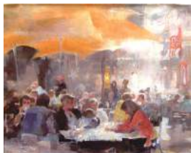
ジャ-ジャン・バイ「時の語らい」F15