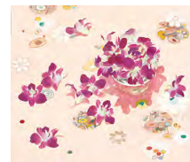
北村 さゆり「再会」10号