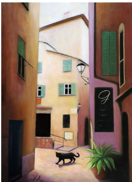
《ヴィルフランシュの裏通り》F4