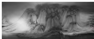
呉一麒「丘繋連綿」60X147cm 純水墨天光系列作品

シルクランド画廊が企画した展覧会で紹介してきた作家を中心に、開廊当時からゆかりの深い中国出身作家など総勢10名の作品を展示いたします。