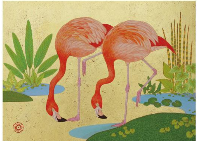
《フラミンゴの居る庭》F4