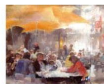
ジャーション・バイ《時の過ぎい》F15

シルクランド画廊16回目の個展。 蘇州、欧州の水辺の風景を中心に 新作の数々をご紹介します。