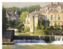
孫家珮《モレの初秋》F15