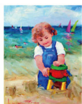
ホンピン・ツォー 《白砂の記憶》 F6