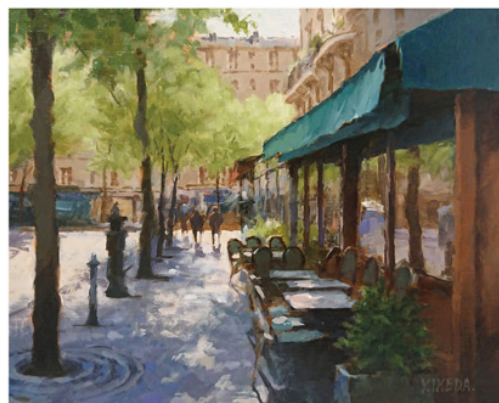
《緑陰歩道とテラス》 F3