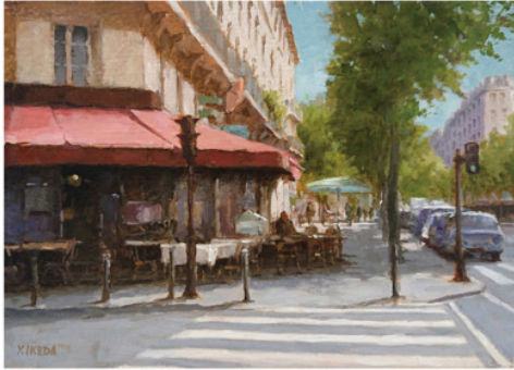
《サンジェルマン大通り》F4