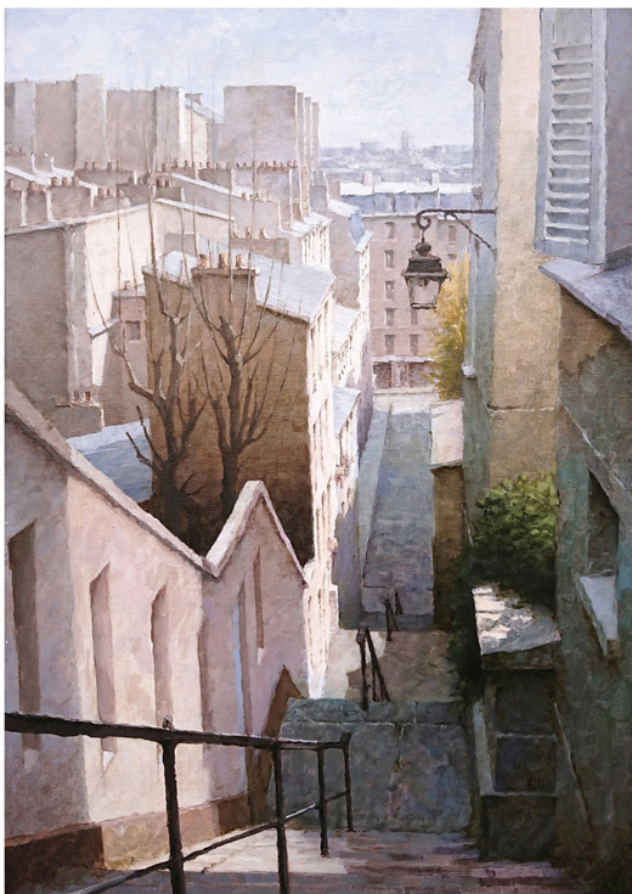
《パサージュ・コタン》 M15