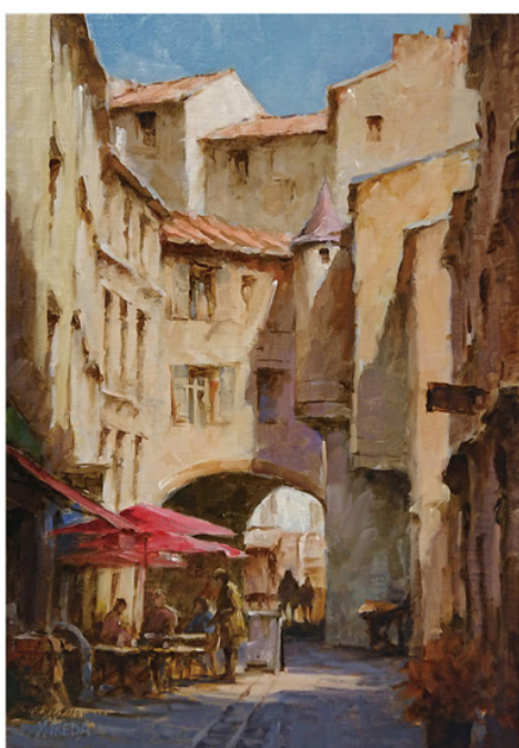
《アーチ通路とパラソル》P5