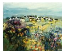
《モン・ヴィラージュ》 F15

京都、秩父、大磯など日本各地の旅先の風景と向き合う中で生まれる作品を紹介。シルクランド画廊5回目の個展。