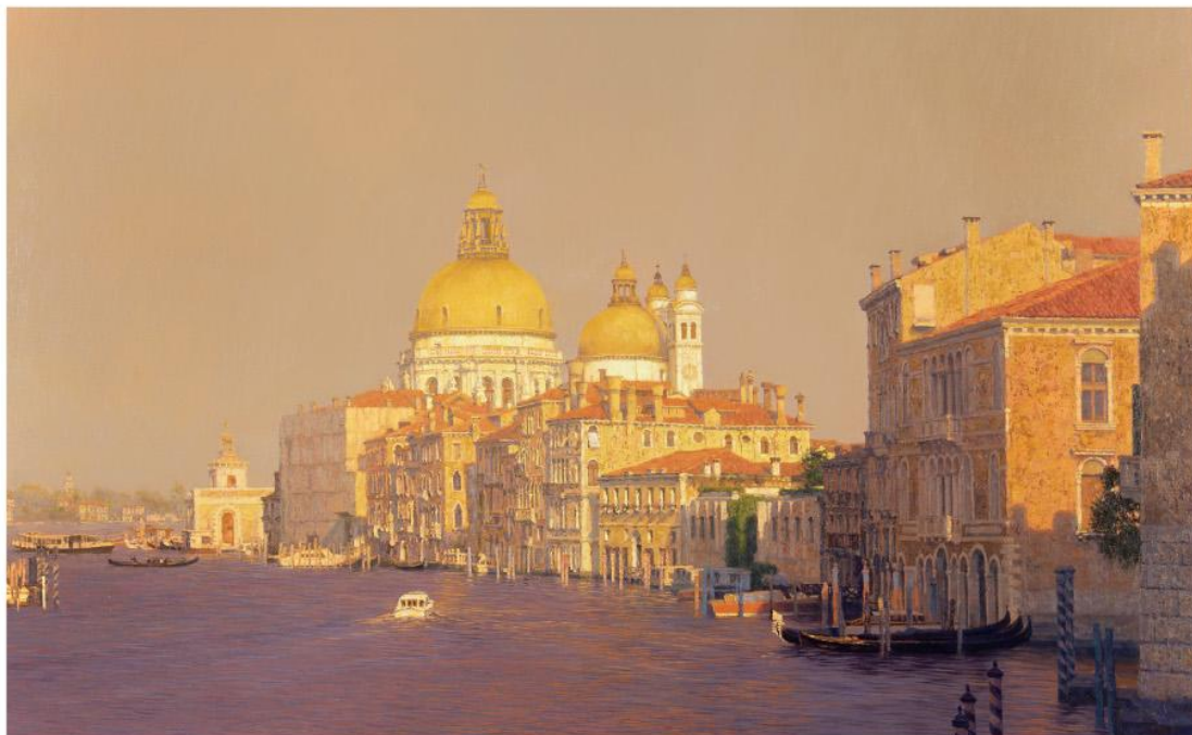
《 canal・グランド》 M60