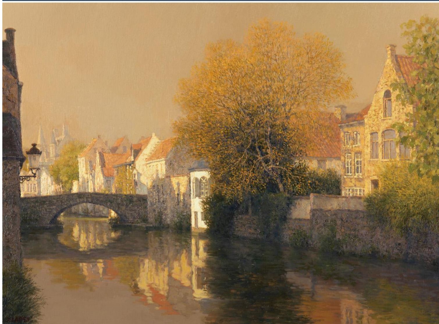
《ブルージュの思い出》P20

No.118 ギャラリー通信 Sep2018 http://www.silkland.co.jp