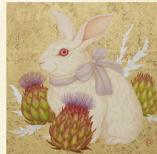
《兔のアーティチョーク添え》S4

1975年 愛知県生まれ 98年 早稲田大学 第二文学部美術史専修卒業/99年 臥龍桜日本画大賞展入選/00年 早見芸術学園造形研究所日本画塾卒業/01年 春季創画展入選/02年 創画展入選/09,15年 アートフェア東京出品