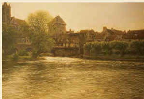
孫家瑠《光の歌》M20 2/26 - 3/18 開廊14周年展