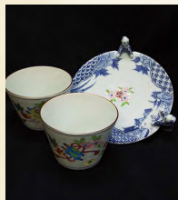
武内裕 京焼き作品 3/19 - 26 武内裕 作陶展