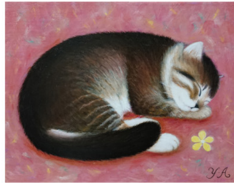
《スイートジュリエット》F0