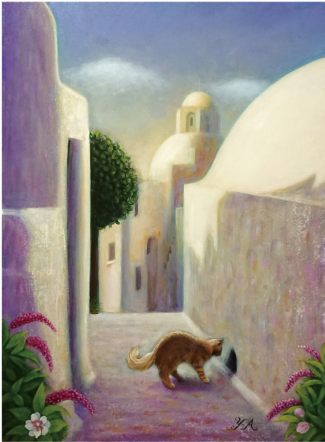
《サントリーニの散策》P8