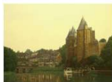
中司 満夫《ブルターニュの古城》P8