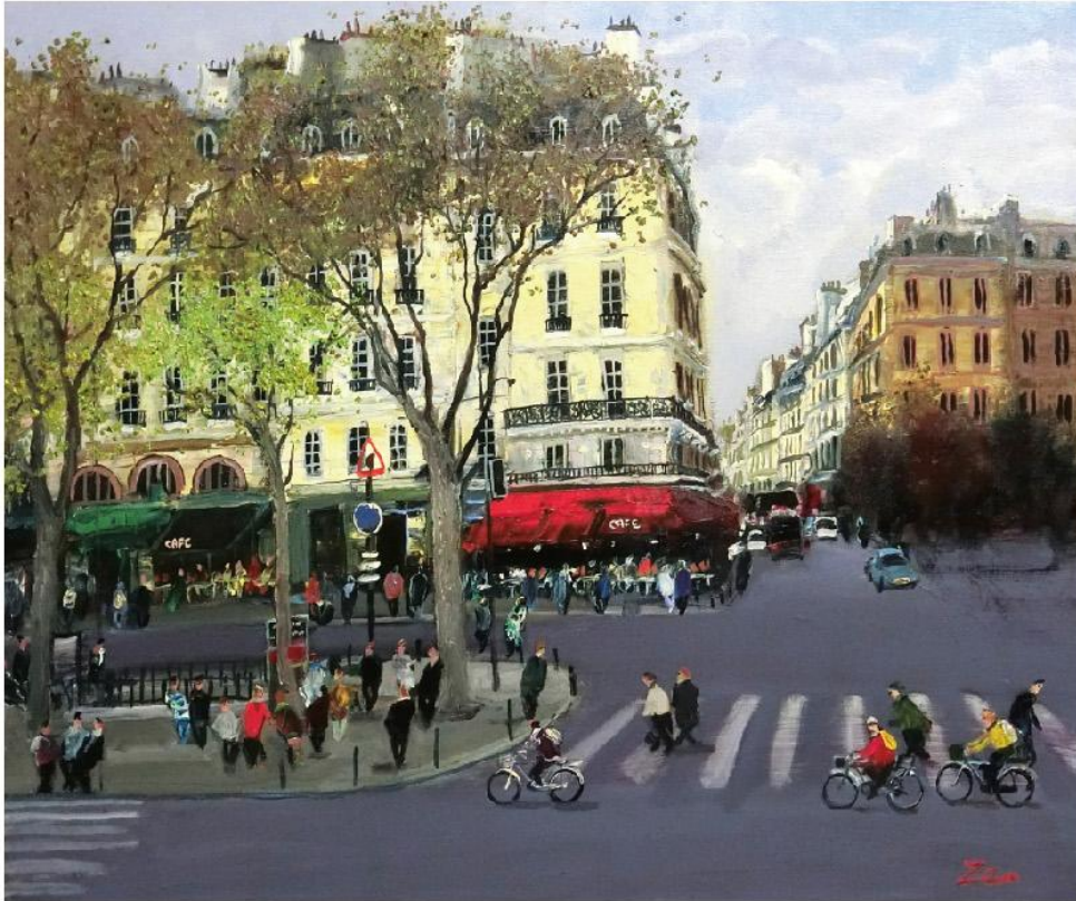
《サンジェルマン通り》F20