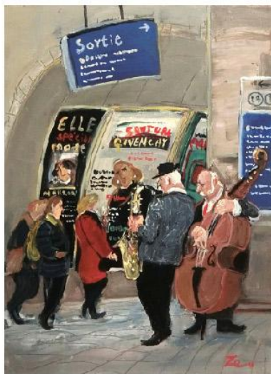
《メトロミュージシャン》F4