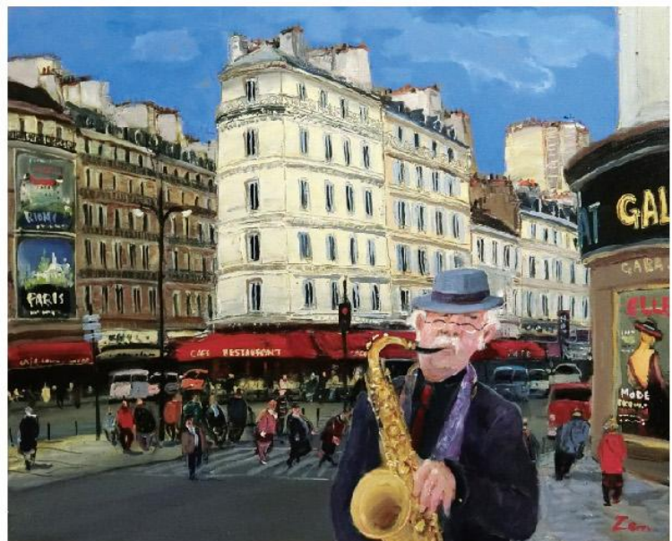
《モンパルナスのサクソ吹き》F15