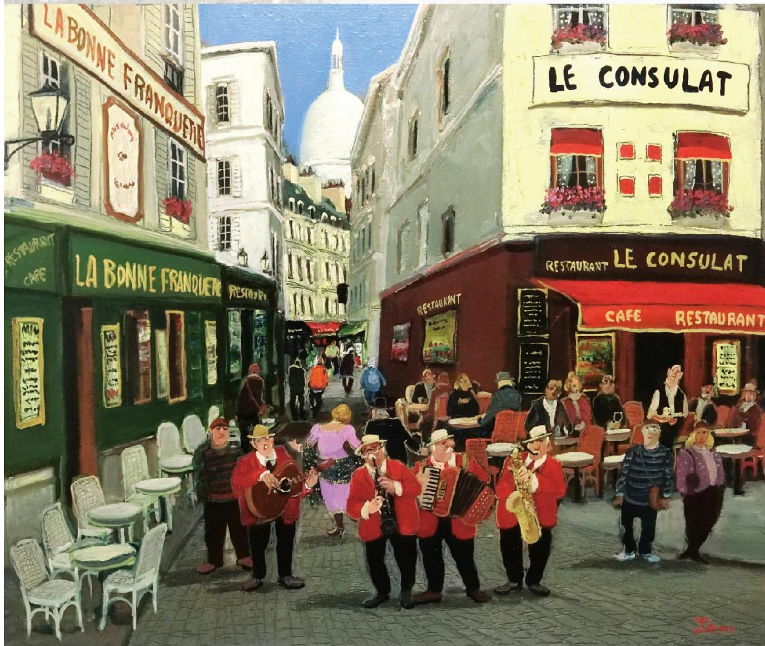
《モンマルトルの丘で》 F20