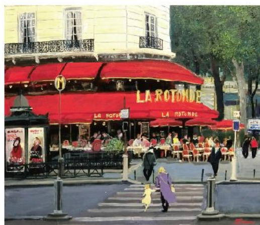
《カフェ・ロトンド》 F10