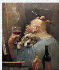
蔡 國華 《五福の時間》F12