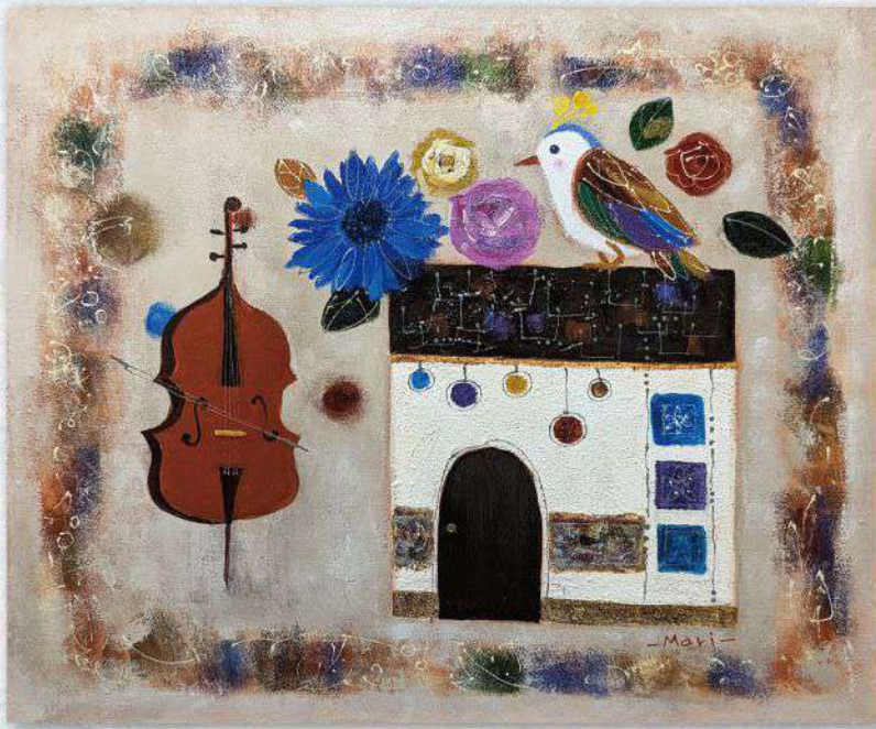
《森の家のシンフォニー》F12